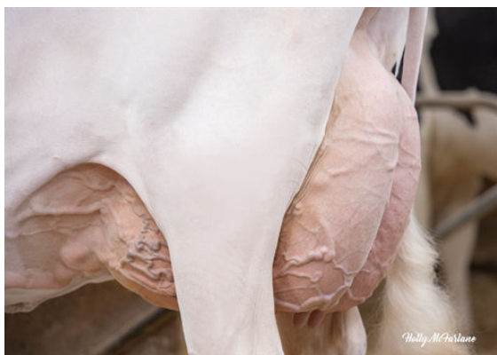
CLAYNOOK ZENA BIGPICTURE DAUGHTER