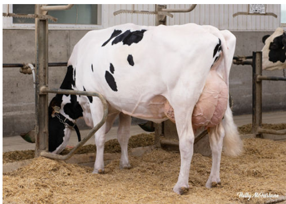
CLAYNOOK ZENA BIGPICTURE DAUGHTER