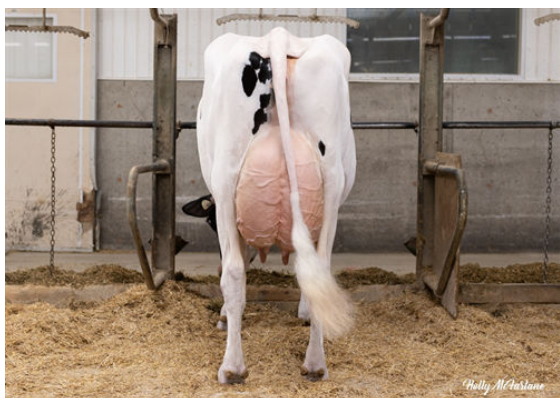
CLAYNOOK ZENA BIGPICTURE DAUGHTER